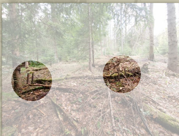
Pozostałości po konstrukcji skoczni