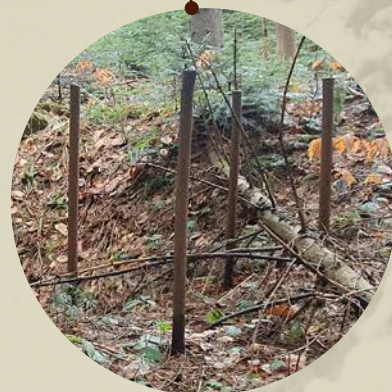
Metalowe elementy konstrukcji