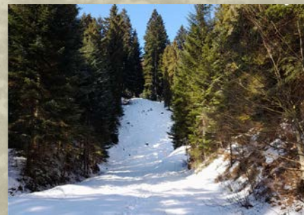
Skocznia, czasy współczesne, rok 2023

Skocznia narciarska przy ulicy Leśnej powstała w 1935 roku wg projektu inż. Bukowskiego i funkcjonowała jako mała skocznia konkursowa. Po II wojnie światowej w 1950 roku przeszła modernizację i została przebudowana na większą. Autorem projektu przebudowy był znany skoczek narciarski - Stanisław Marusarz . Skocznia funkcjonowała do połowy lat 50-tych XX wieku. Obiekt szybko uległ zniszczeniu i zaprzestano na nim skoków.