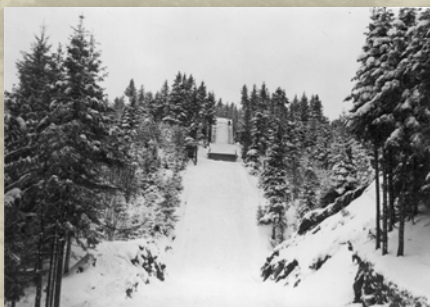
Skocznia, rok 1925-1939

Co po nich zostanie? Narty i skokanie...