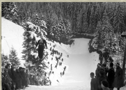
Zawodnik podczas skoku, rok 1938