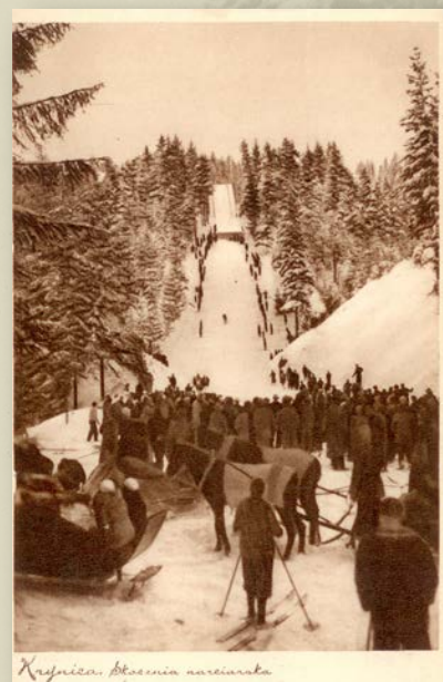
Stara karta pocztowa z widokiem na skocznię

Oznakowanie K-45 - punkt K określa wielkość skoczni, jest to środkowy punkt strefy lądowania.