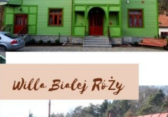
Willa Białej Róży