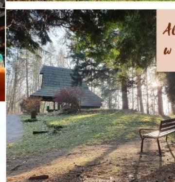
Altany drewniane w Parku Zdrojowym