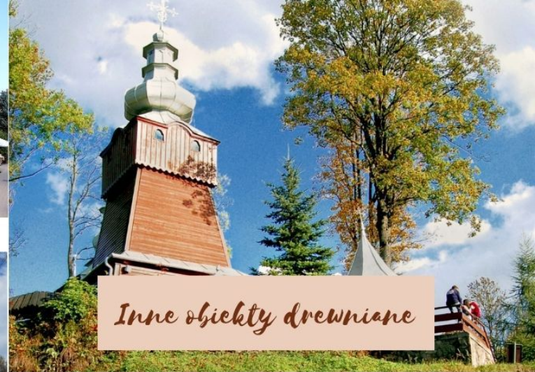
Inne obiekty drewniane