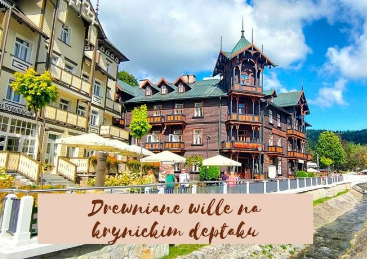
Drewniane wille na krynickim deptaku